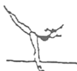
Posição de equilíbrio (5%)